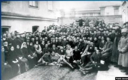
УЧАСНИКИ ПЕРШОГО КУРУЛТАЮ КРИМСЬКОТАТАРСЬКОГО НАРОДУ, БАХЧІСАРАЙ, ЛИСТОПАД 1917Р.

"Ми хочемо врятувати Крим від анархії. І для того, щоб надійніше захистити його, кримські мусульмани вирішили створити Курултай.. Можливо, наше рішення підтримають і захочуть працювати разом з нами всі народності, які населяють Крим".