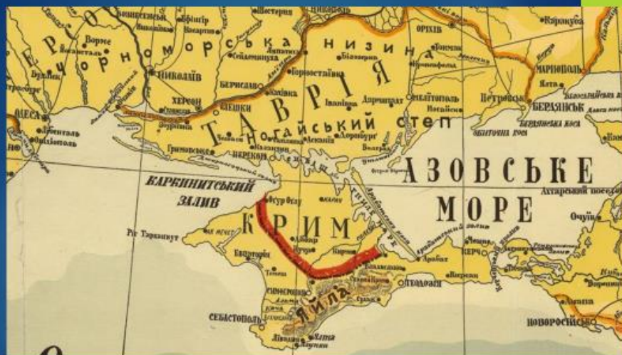
Крим на карті України 1918 року