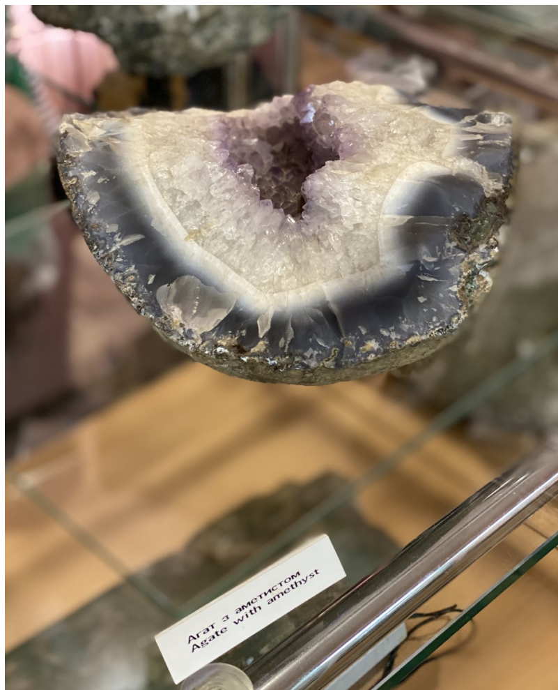
Агат з аметистом Agate with amethyst