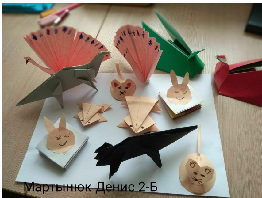
Мартынюк Денис 2-Б