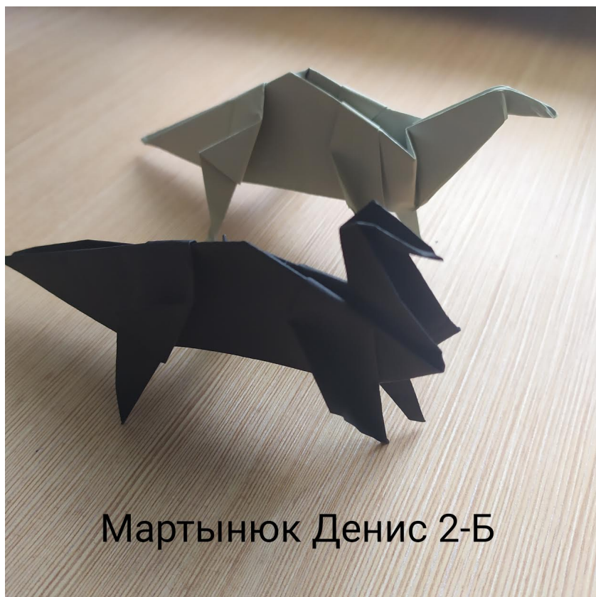
Мартынюк Денис 2-Б